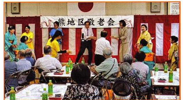
出席者も踊りに加わり、盛り上がりました！