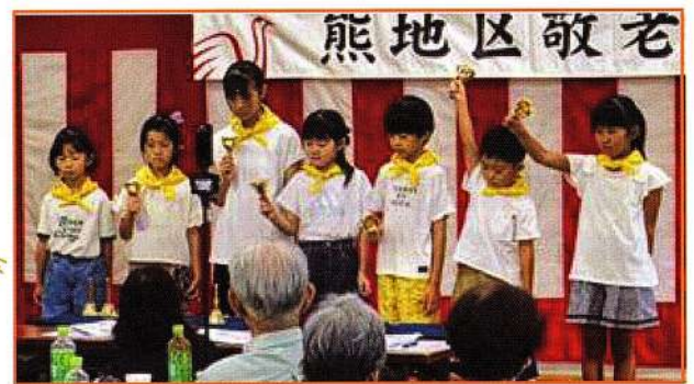
「熊の子音楽隊」によるハンドベル演奏 とても美しい音色♪で癒されました