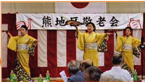
熊民謡愛好会による踊りが披露されました